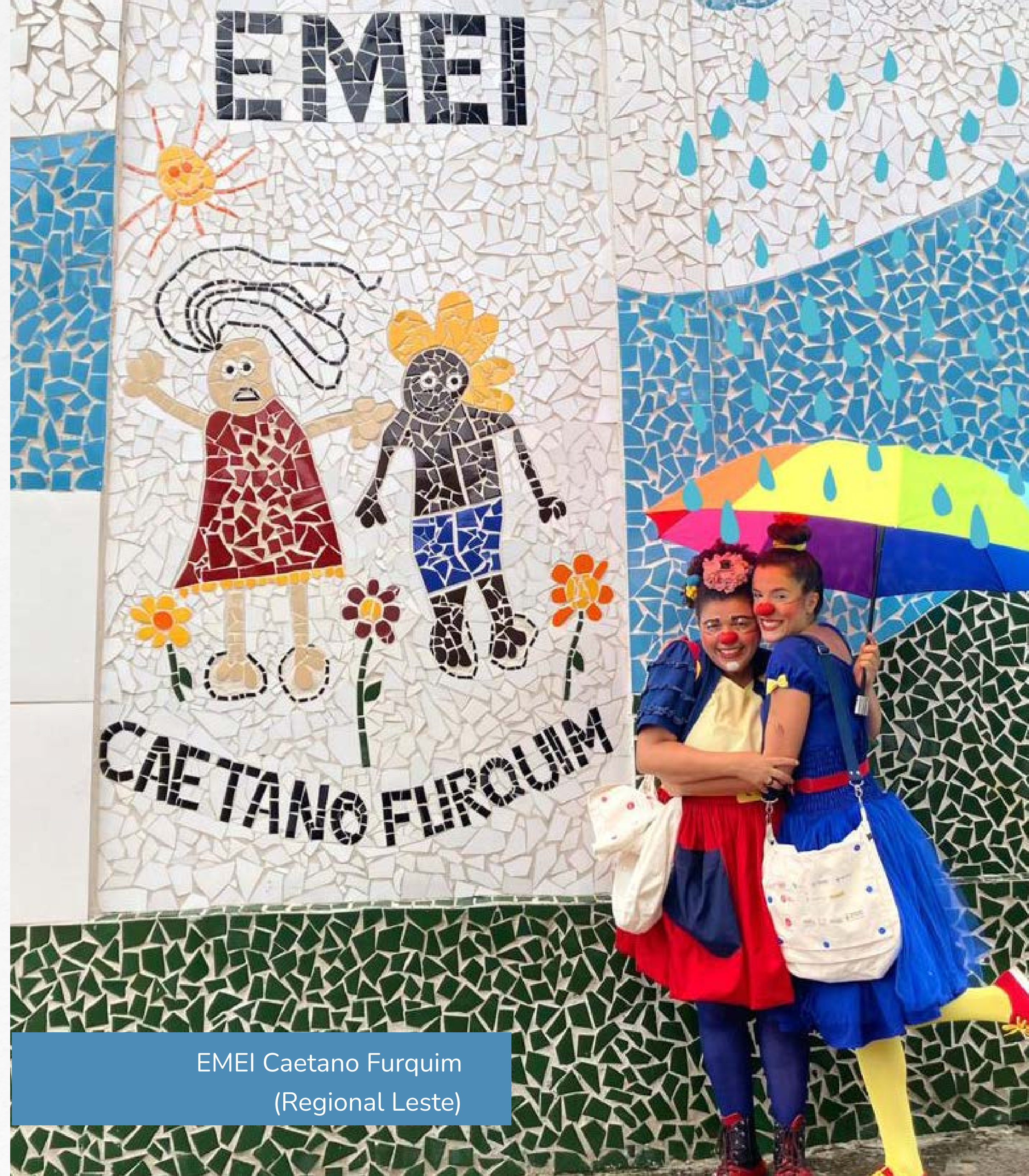
EMEI Caetano Furquim (Regional Leste)