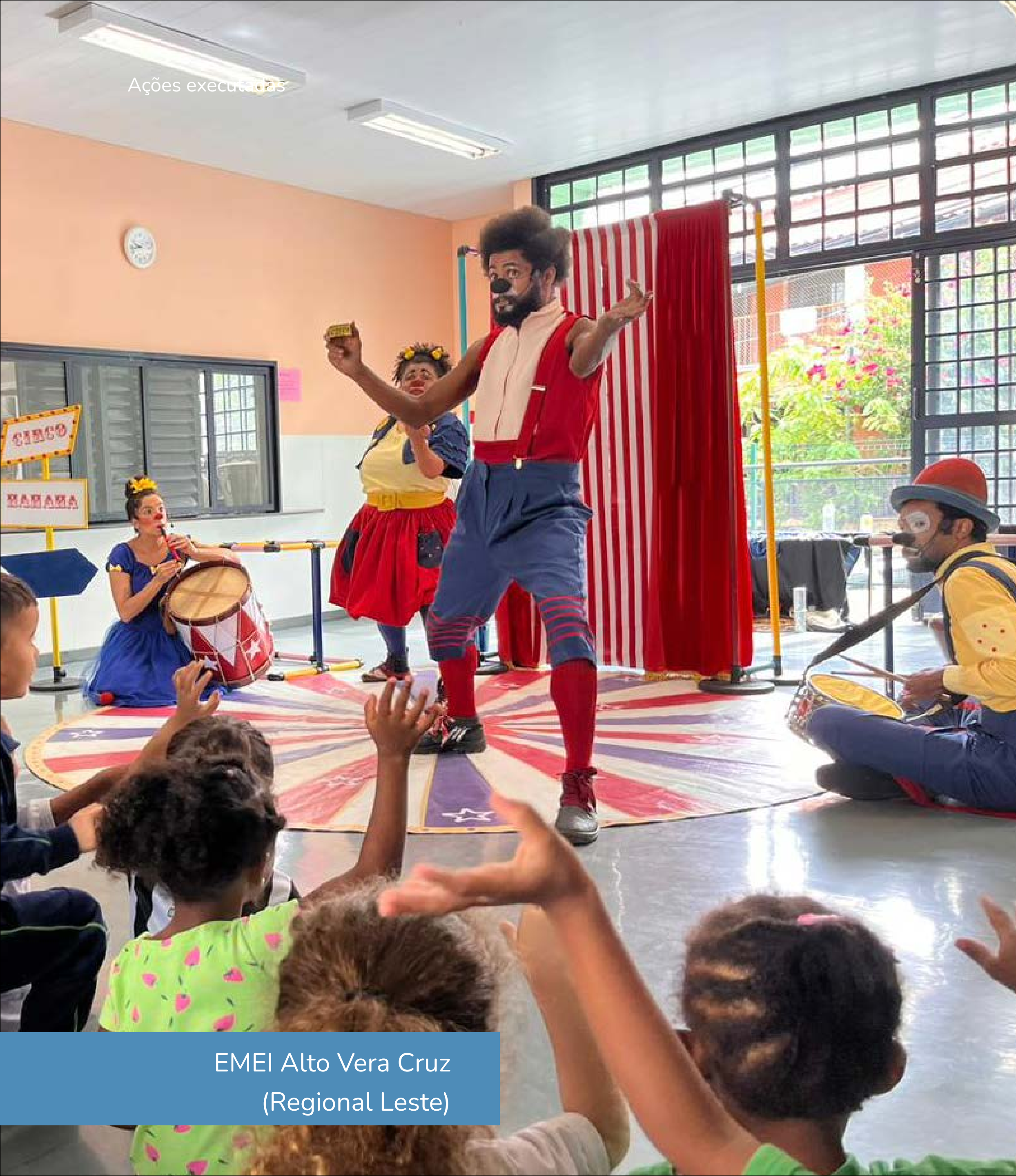
EMEI Alto Vera Cruz (Regional Leste)