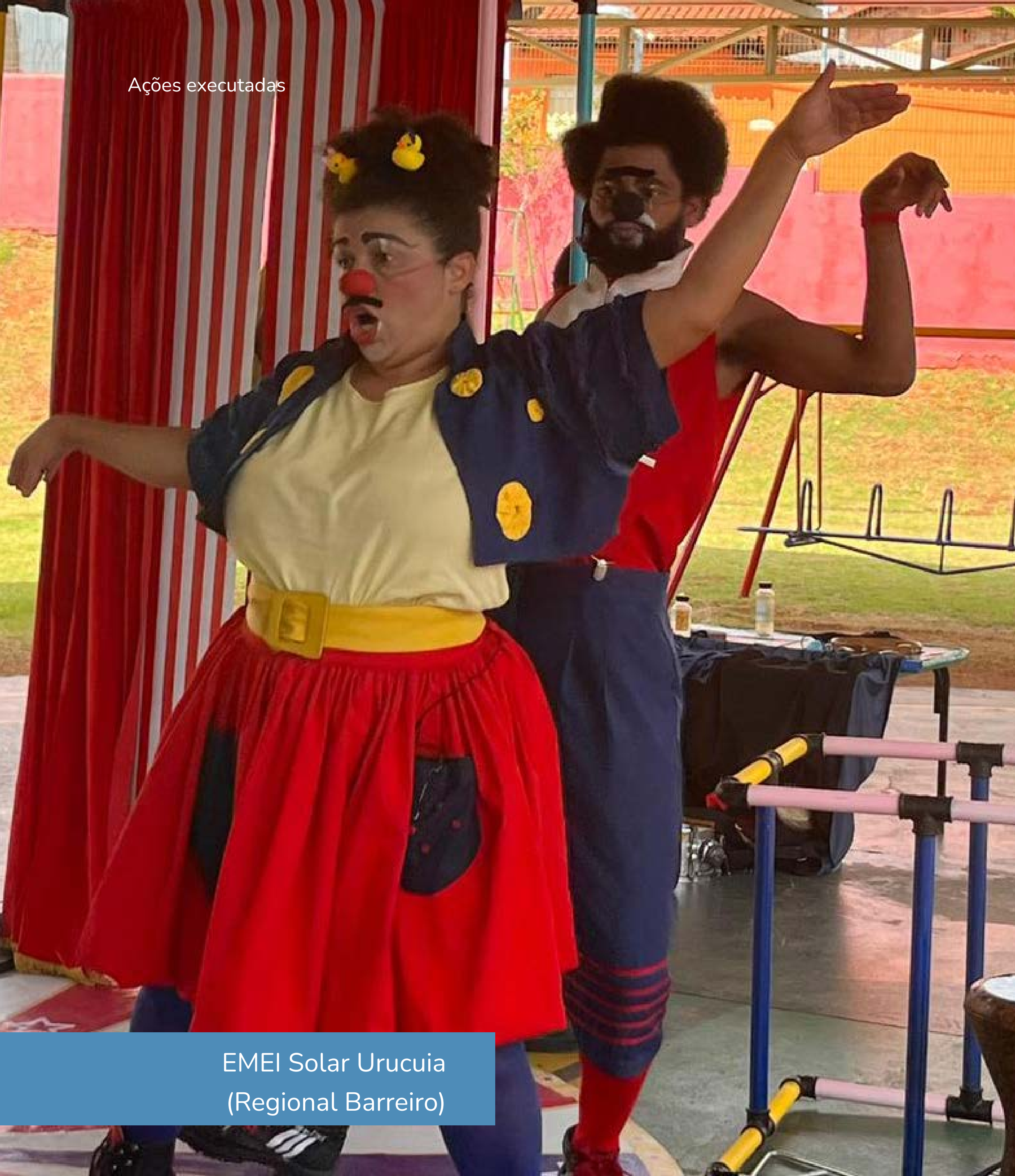
EMEI Solar Urucuia (Regional Barreiro)