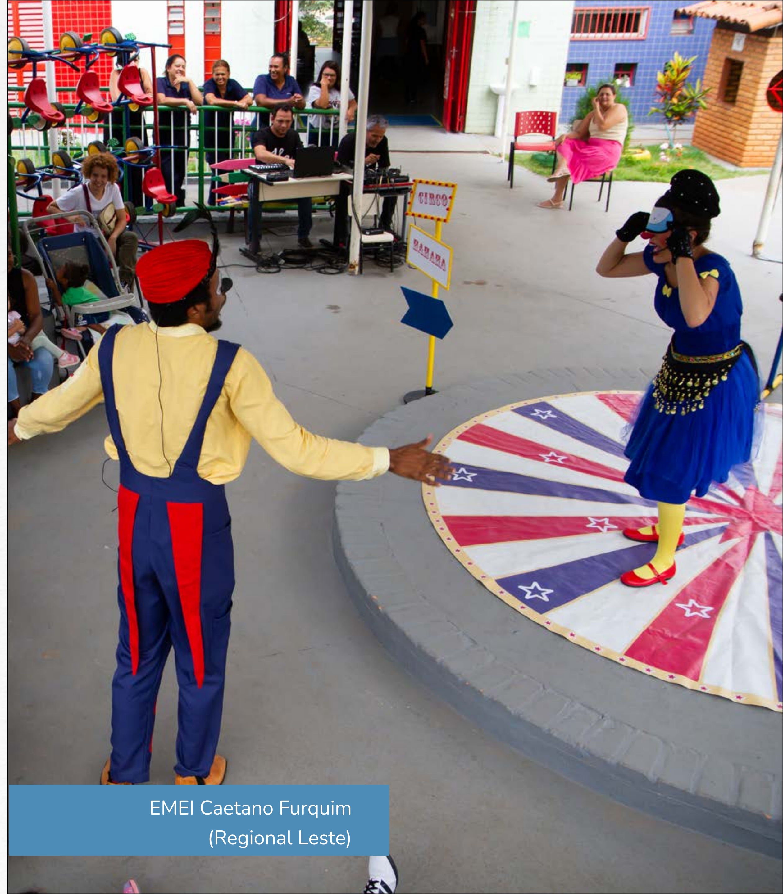
EMEI Caetano Furquim (Regional Leste)