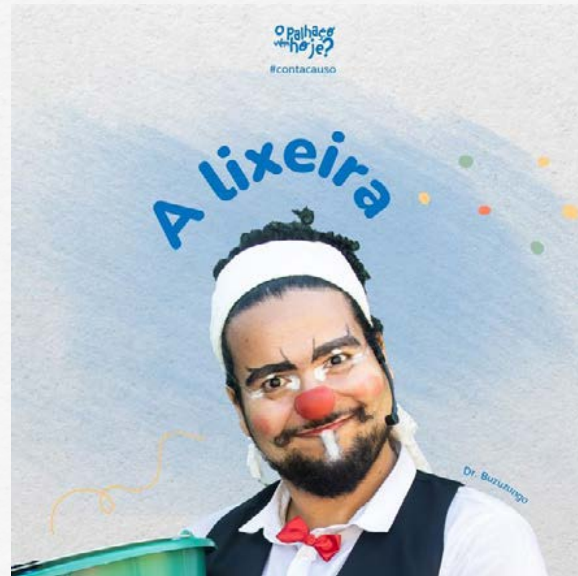
Veja a publicação no Facebook e no Instagram