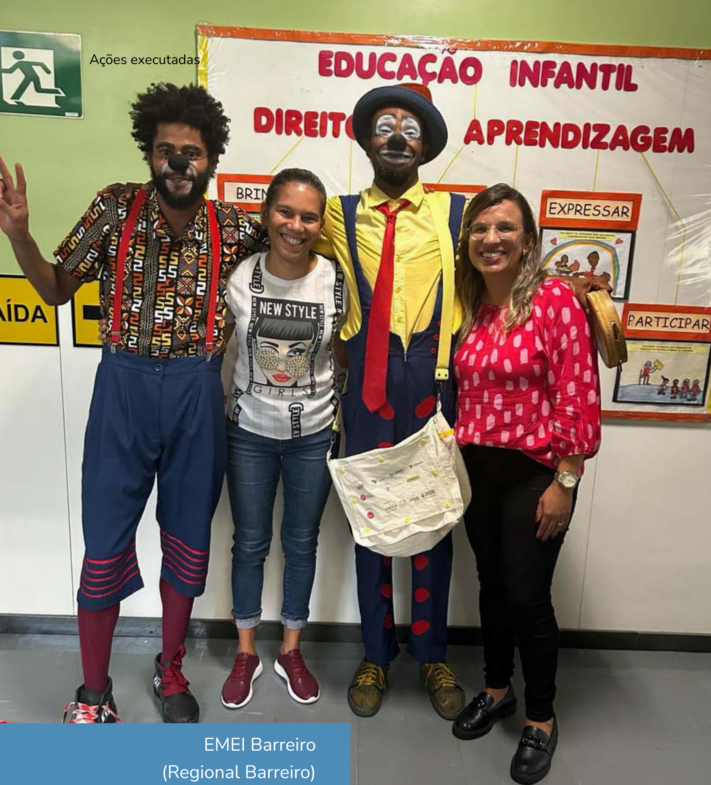
EMEI Barreiro (Regional Barreiro)