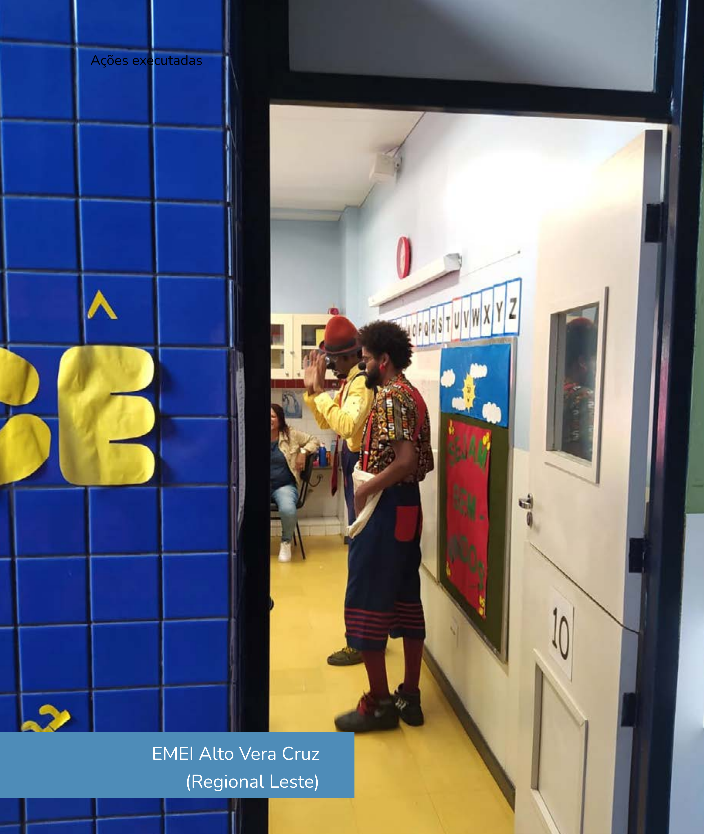
EMEI Alto Vera Cruz (Regional Leste)