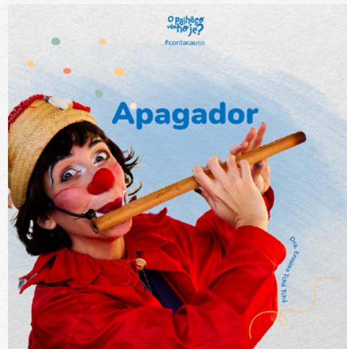
Veja a publicação no Facebook e no Instagram