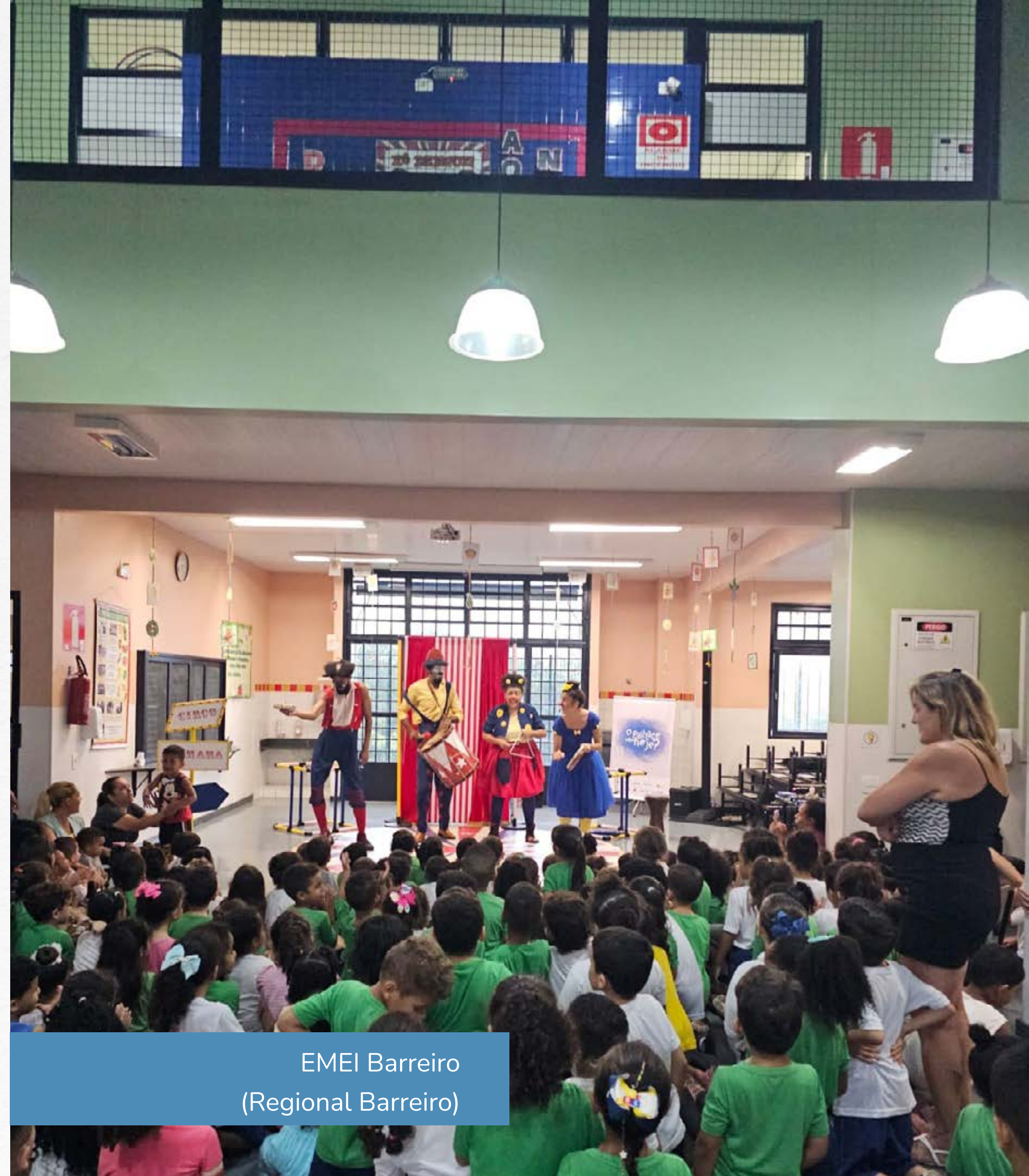
EMEI Barreiro (Regional Barreiro)