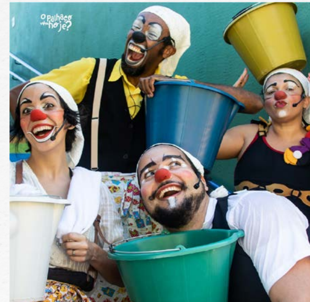
Veja a publicação no Facebook e no Instagram