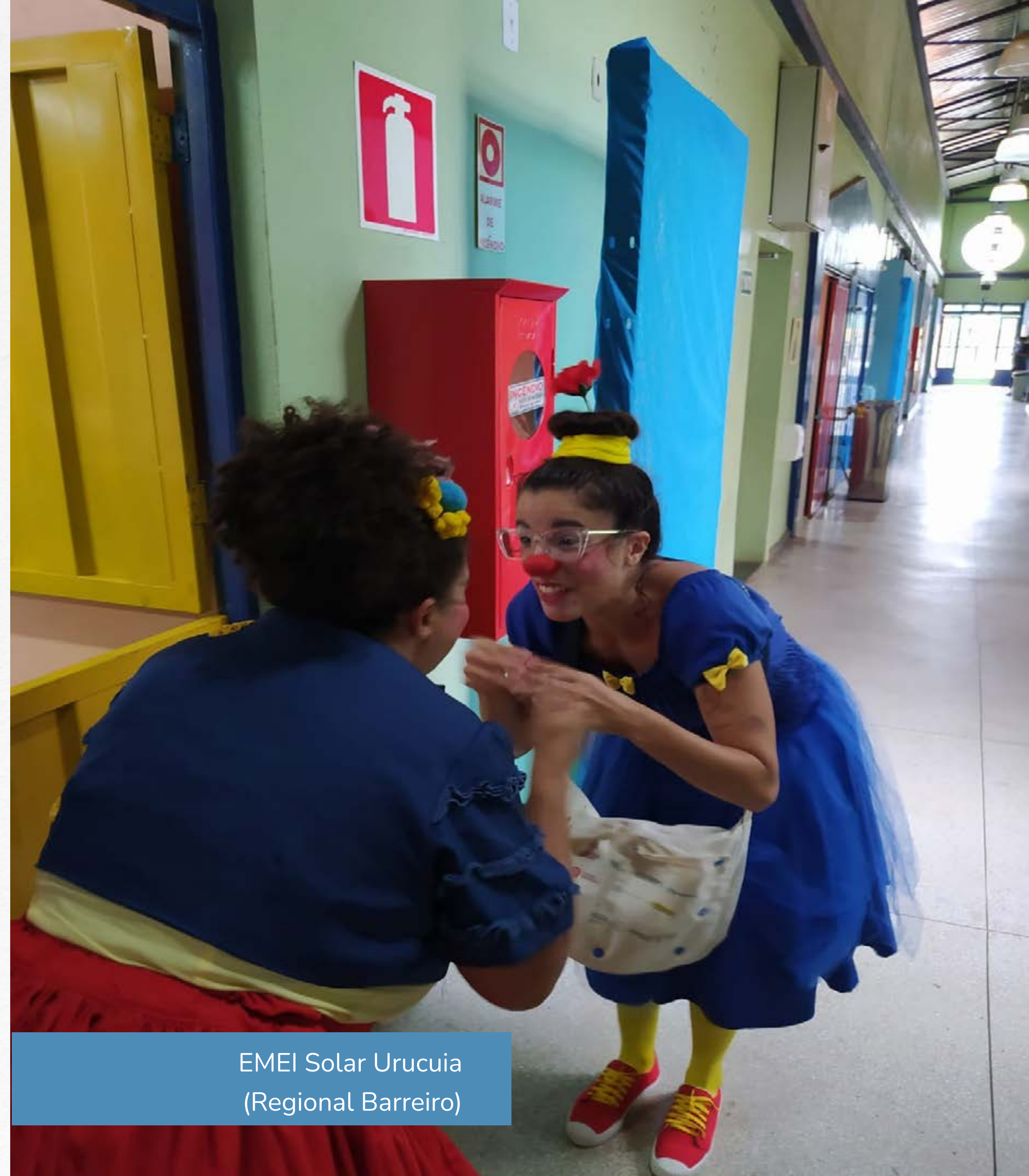
EMEI Solar Urucuia (Regional Barreiro)