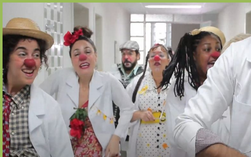
Harraia do Hahaha