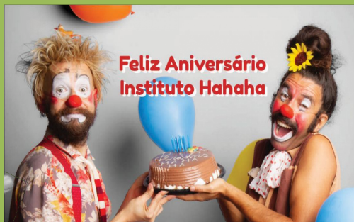
10 anos de Instituto Hahaha